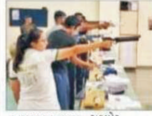
નવગુજરાત સમય > રાજકોટ